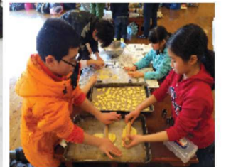
たのしかったクッキーづくり